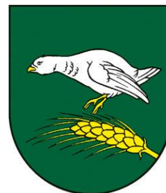
Obrázok 2 Erb obce

Erb obce Hraň tvorí z ľavého dolného okraja zeleného štítu vyrastajúci položený zlatý klas, nad ním strieborný prirodzený letiaci jariabok v zlatej zbroji.